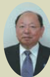
第2区 中村 剛志氏

玉水寿清議員の退職に伴う組合会議員補欠選挙(市町村長が選挙する議員の選挙区第2区)を9月25日に実施した結果、中村剛志氏(砥部町長)が当選されました。なお、中村議員の任期は、平成20年11月30日までとなっております。