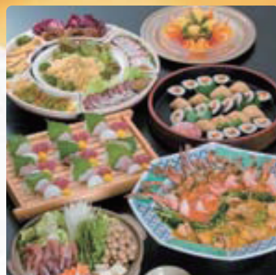
オードブル/3,500円(8人盛り)

◎その他ご予算に合わせてご用意させていただきますので、係にお問い合わせください。