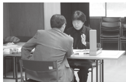
共済組合保健師による積極的支援

本年度から新規に導入されたばかりの制度であるため、厚生労働省の定める形式による電子媒体での健診データ提供等に対応できていない健診機関があるなど、実施体制の整備が遅れているため、一部の方に対して特定保健指導の実施・案内ができない場合がありますので、あらかじめご了承ください。