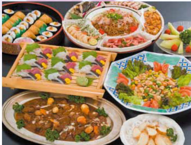
オードブル/3,500円(8人盛り)