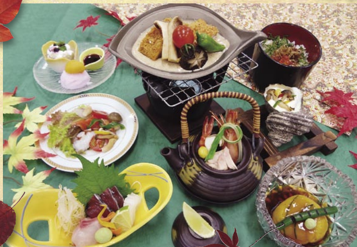
※朝食はバイキング形式となります。